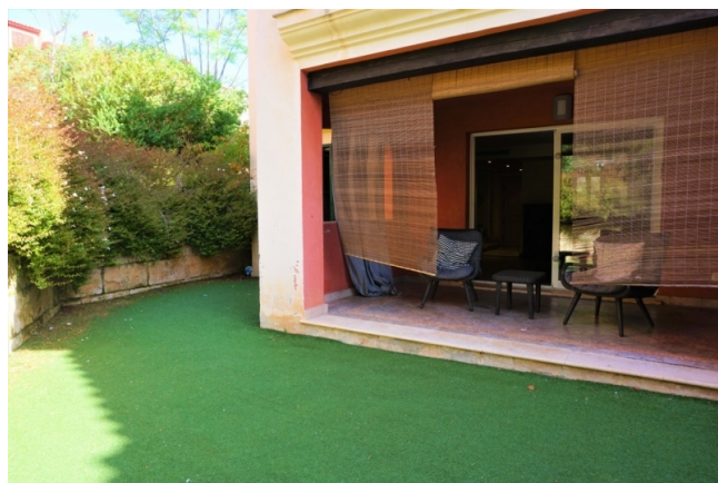
Mallorca kaufen Reihenhaus