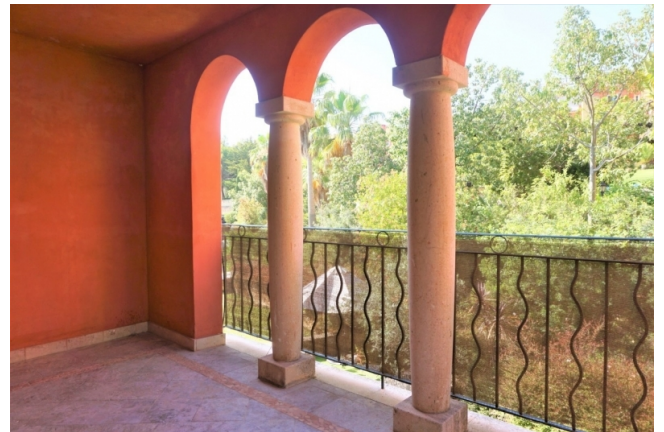
Mallorca Immobilien kaufen