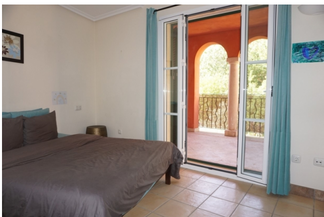
kaufen Mallorca Reihenhaus