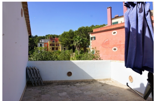
kaufen Mallorca haus