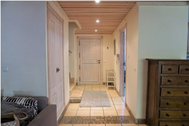
Eckhaus Mallorca kaufen