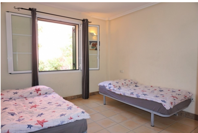
for sale Mallorca house