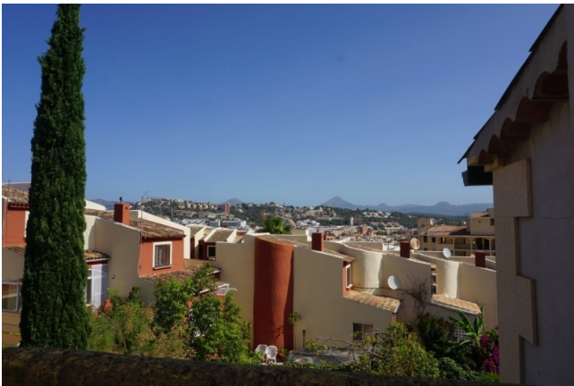
kaufen Mallorca Haus